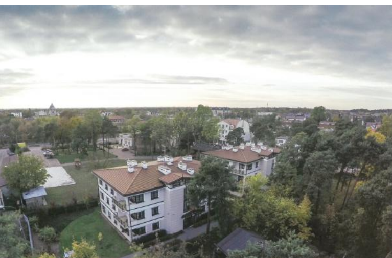
Widok na ulicę Kościelną

Okolicznościową publikację otwiera zdjęcie ukazujące jako pewną alegorię rozwoju - szlak kolejowy do Warszawy - perspektywę ewolucyjną. Koresponduje z tą wizją słowo wstępne Prezydenta Miasta – Zbigniewa Szczepaniaka.