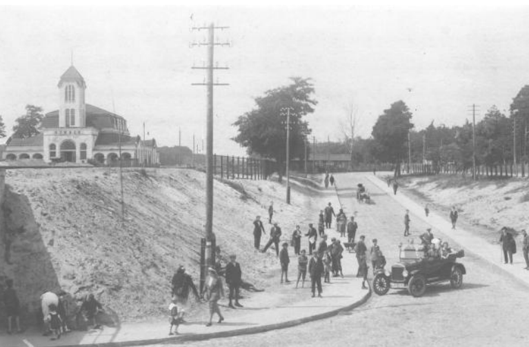
Dworzec kolejowy. Lata 30. XX wieku