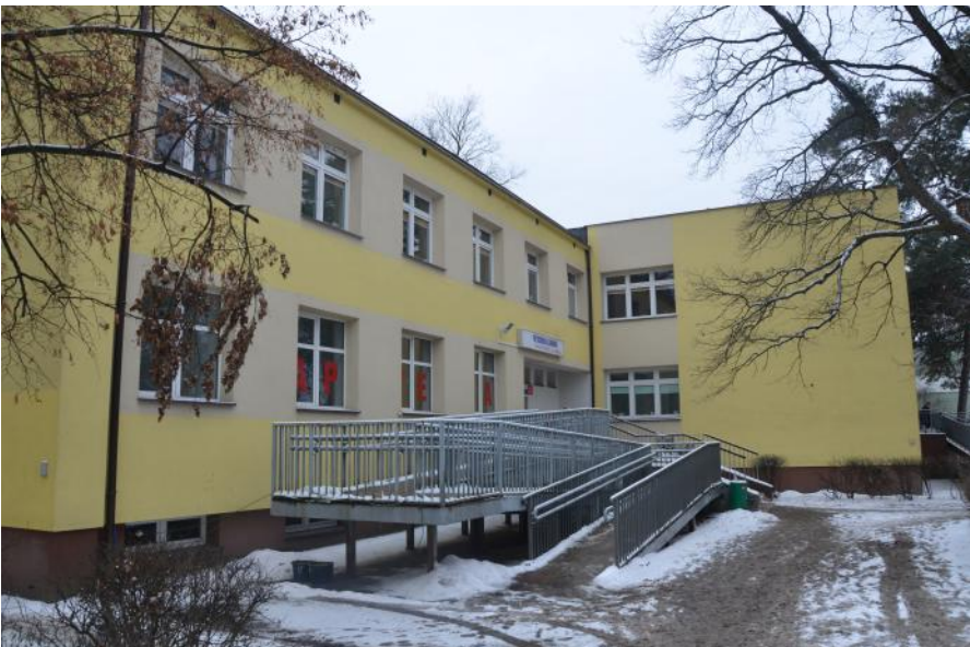
Na terenie powiatu usługi nocnej i świątecznej pomocy lekarskiej świadczy placówka mieszcząca się w Otwocku przy ul. Armii Krajowej 3

kadrowym związanym z urlopami powodują, że do drzwi placówek świadczących usługi nocnej pomocy lekarskiej pukają większe niż zazwyczaj ilości pacjentów.