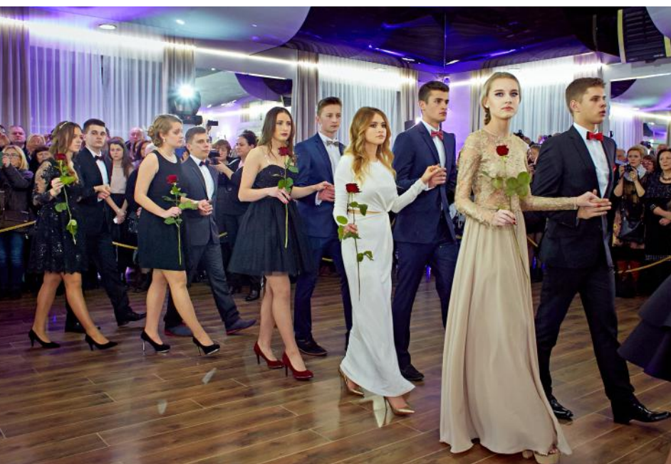
Tradycyjny Polonez w wykonaniu uczniów Liceum Ogólnokształcącego nr III im. J. Słowackiego w Otwocku

Wobec faktu nieuchronnie zbliżającej się matury, nawiązując do wieloletniej tradycji, Abiturienti szkół ponadgimnazjalnych prowadzonych przez Powiat Otwocki w minionym miesiącu styczniu bawili się na balach studniówkowych.