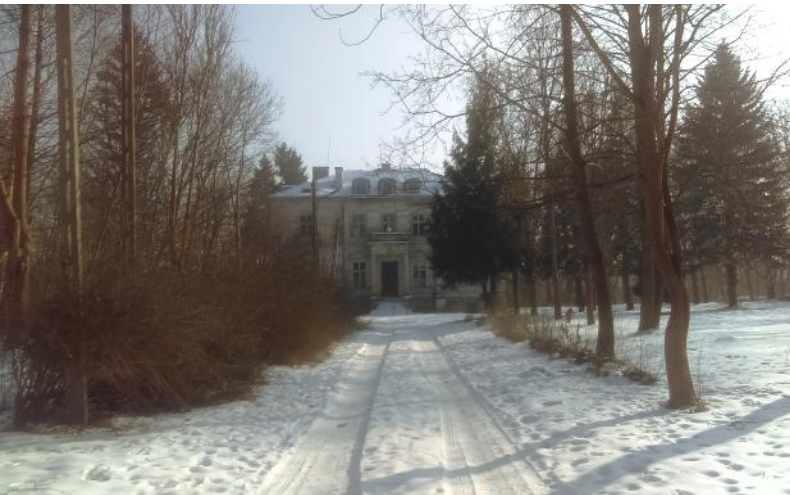
Budynek Pałacu Zamoyskich

Zarząd Powiatu w Otwocku ogłasza drugi ustny przetarg nieograniczony na sprzedaż zabudowanej nieruchomości stanowiącej własność Powiatu Otwockiego.