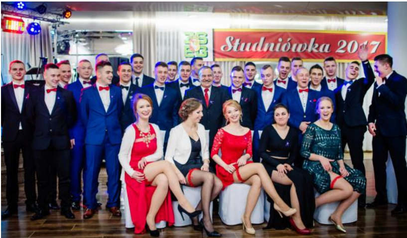
Zespół Szkół Ekonomiczno - Gastronomicznych im. Stanisława Staszica w Otwocku