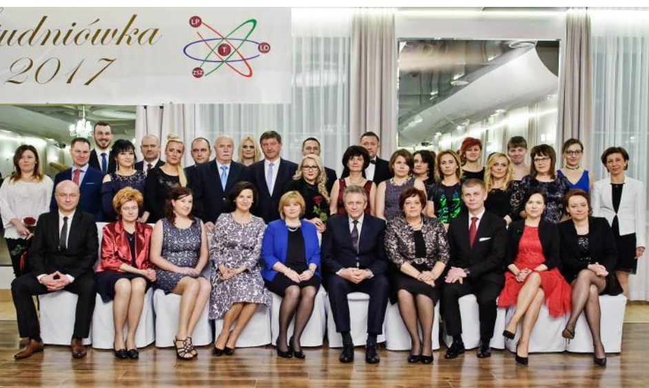
Grono pedagogiczne Zespołu Szkół Nr 2 w Otwocku wraz z przedstawicielami władz samorządowych

Pierwszą szkołą, która zainaugurowała tegoroczny sezon „studniówkowy” był Zespół Szkół Ekonomiczno – Gastronomicznych im. St. Staszica w Otwocku, który zorganizował studniówkę 7 stycznia. Kolejne imprezy odbyły się 14 stycznia – w Liceum Ogólnokształcących im. K. I. Gałczyńskiego w Otwocku i w Liceum Ogólnokształcącym nr III im. J. Słowackiego w Otwocku. Ostatnią szkołą, która zorganizowała studniówkę w dniu 28 stycznia był Zespół Szkół Nr 2 im. Marii Skłodowskiej Curie w Otwocku w Otwocku.