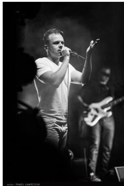
Zespół Coma wystąpi podczas tegorocznego Powiatowego Festiwalu Kultury

Już po raz czternasty odbędzie się w czerwcu Powiatowy Festiwal Kultury. Występy sceniczne rozpoczną pokazy dla dzieci, natomiast część popołudniowa i wieczorna zostanie przejęta przez zespoły rockowe. Wystąpi znana i lubiana grupa lokalna The Rookles, a także gwiazdy wieczoru: zespół Coma i Luxtorpeda. Grupa Coma powstała w 1998 roku w Łodzi. Mają na swoim koncie takie przeboje jak, System, Zero Osiem Wojna, czy Skaczymy. Natomiast Luxtorpeda zadebiutowała na rynku muzycznym w 2011 roku. Znani są z takich utworów jak: Hymn, czy Wilki Dwa. Wszystkich, którzy lubią mocne brzmienia zapraszamy do Otwocka już 11 czerwca br. Dodatkową atrakcją imprezy będą stoiska rękodzielnicze. Mamy nadzieję, że czerwcową niedzielę przyciągnie wiele osób, dlatego w tym roku odbędzie się na stadionie OKS w Otwocku. O szczegółach wydarzenia będziemy informowali na naszej stronie internetowej i w lokalnych mediach.